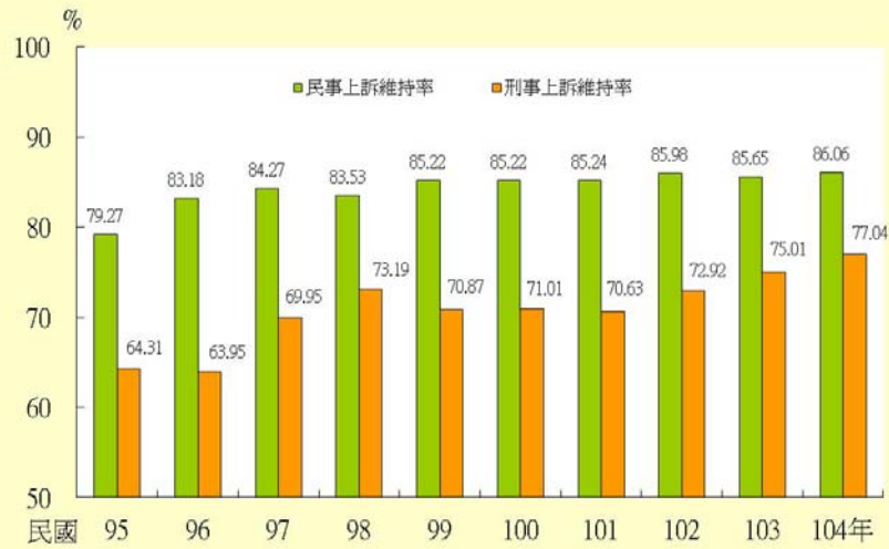
圖2.1 臺灣各地方法院民、刑事上訴維持率

下降至 83.53%，99 年起又逐年微幅上升，至 104 年為 86.06%，係因「法院計算辦案維持率應視為維持範圍及審查要點」陸續修正重大民刑案件、家事專業案件、不同年度視為維持案件之維持率計列方式，及視為維持範圍擴及刑事自訴案件。至於刑事上訴維持率，自 97 年之後因上述原因而提高到七成以上，98 年上升至 73.19%，99 年降為 70.87%，100 年及 101 年的變動幅度均不及 1 個百分點，102 年起又持續上升，至 104 年上訴維持率達 77.04%，為近十年來新高。